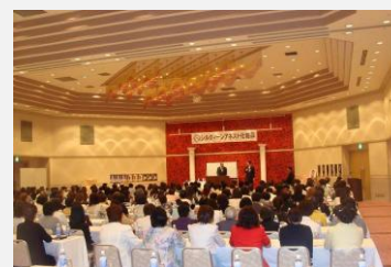
Juli 2010 Chaga Betula lezing in Japan